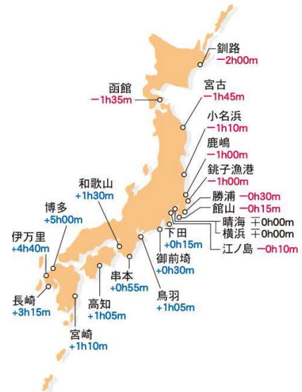
[潮時差] 東京・晴海基準

上図は、「潮見カレンダー」の凡例です。干満の時刻・潮位の曲線以外にも多くの情報を載せています。